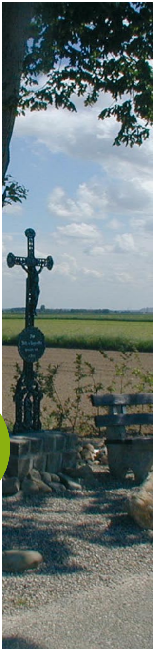
Feldkreuz bei Harzelt

Fahrrad-Service: s. Wissenswertes von A - Z